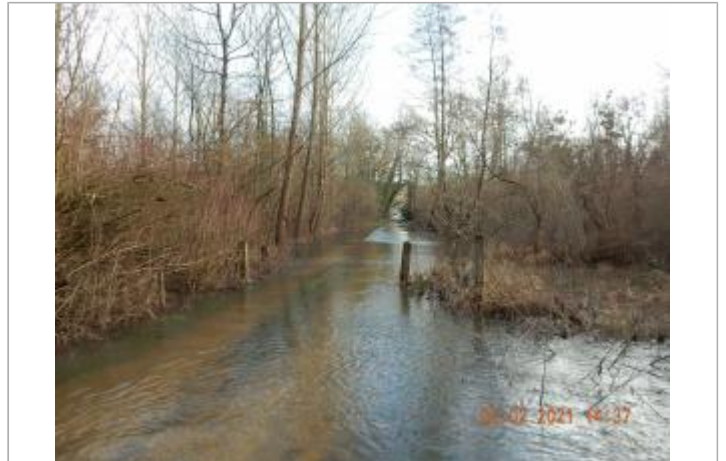
Poteau sur chemin forestier