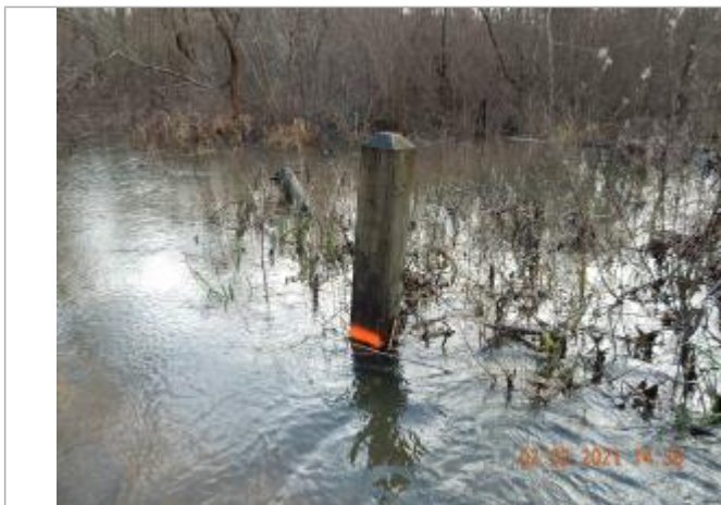
marque de peinture sur poteau en ciment

Altitude calculée de l'eau (en m) : 22.864