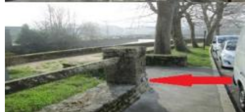
Muret rue Emile Zola