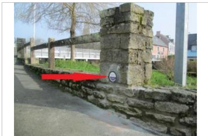
Repère normalisé de l'inondation du 5 janvier 2001