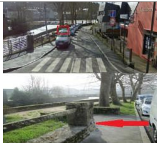
Muret rue Emile Zola