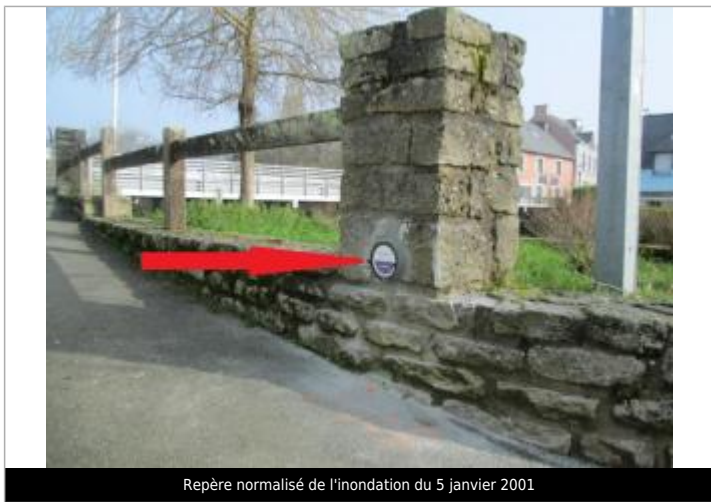
Repère normalisé de l'inondation du 5 janvier 2001

GÉNÉRAL Code : BLA_INZINZAC_1 Date de mise à jour : 18/03/2021 Auteur : SPC VCB