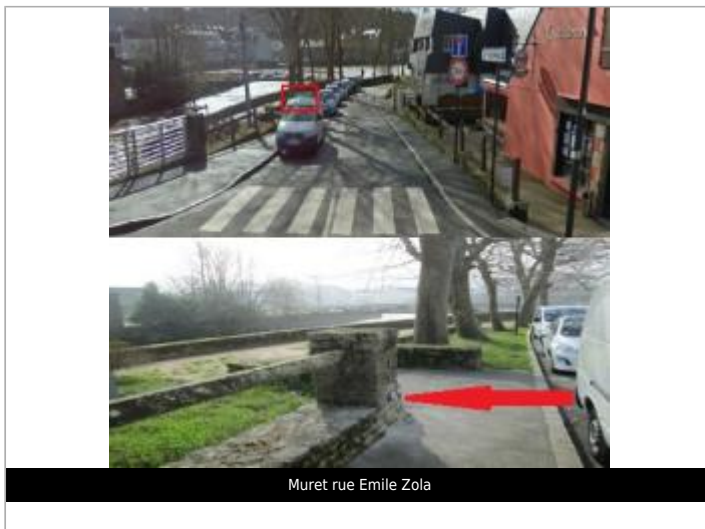
Muret rue Emile Zola

GÉOLOCALISATION Coordonnées WGS84 : X: -3.24947400 / Y: 47.82663780 Coordonnées RGF93 (Lambert 93) X: 232880.23 / Y: 6765855.06 Coordonnées RGF93 (ETRS89) : X: -3.249474 / Y: 47.8266378 Code Hydro: J5--0210 Rive de référence: Droite