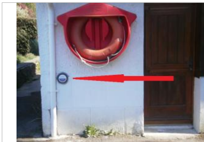
repère normalisé de la crue du 26 janvier 1995

Texte : Inondation janvier 1995 - Le Blavet