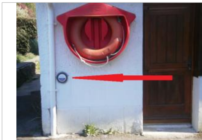
repère normalisé de la crue du 26 janvier 1995

Texte : Inondation janvier 1995 - Le Blavet