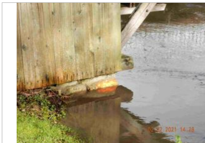
marque de peinture sur le lavoir

NIVELLEMENT SPC SACN. LE SPC N'EST PAS GÉOMÈTRE EXPERT, LES COTES SONT DONNÉES À TITRES INDICATIF. - 17/02/2021