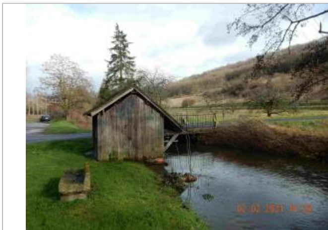
lavoir en face du n°1 impasse des marais