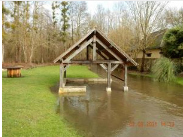
Lavoir rue de l'Eau