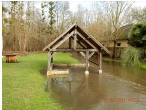
Lavoir rue de l'Eau