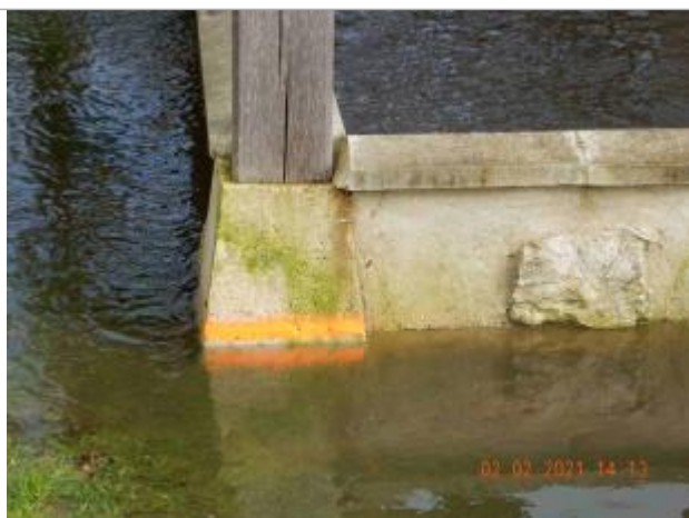
marque de peinture sur le lavoir

Altitude calculée de l'eau (en m) : 18.354