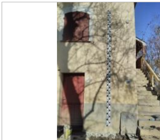
Vue du site - Auteur ALM

Coordonnées WGS84 : X: -0.55950000 / Y: 47.50340000