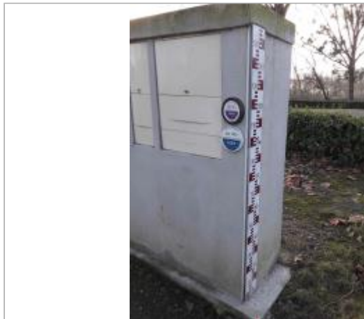
Vue du site - Auteur ALM

Coordonnées WGS84 : X: -0.52930000 / Y: 47.42430000