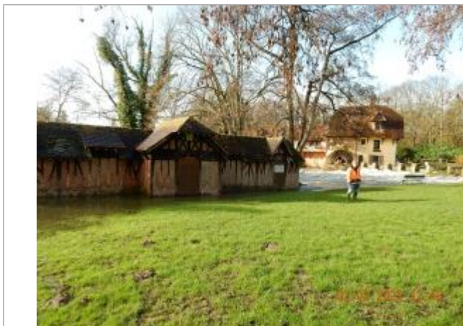
Bâtiment sur la rive gauche, face au moulin de Fourges