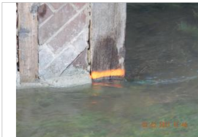
Trace de peinture sur le bâtiment

NIVELLEMENT SPC SACN. LE SPC N'EST PAS GÉOMÈTRE EXPERT, LES COTES SONT DONNÉES À TITRES INDICATIF. - 17/02/2021