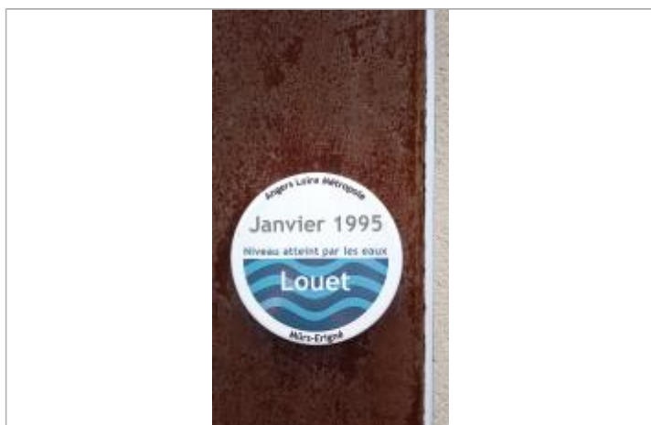
2025_Vue du repère