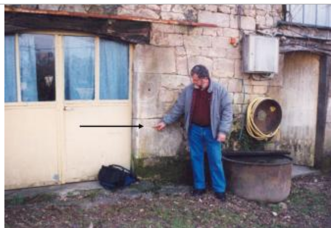
Vue sur un bâtiment qui porte un repère de crue non daté. Selon l'occupant de la maison il s'agit de la crue du 08/12/1944.