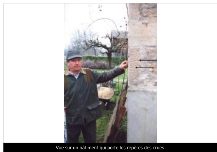
Vue sur un bâtiment qui porte les repères des crues.