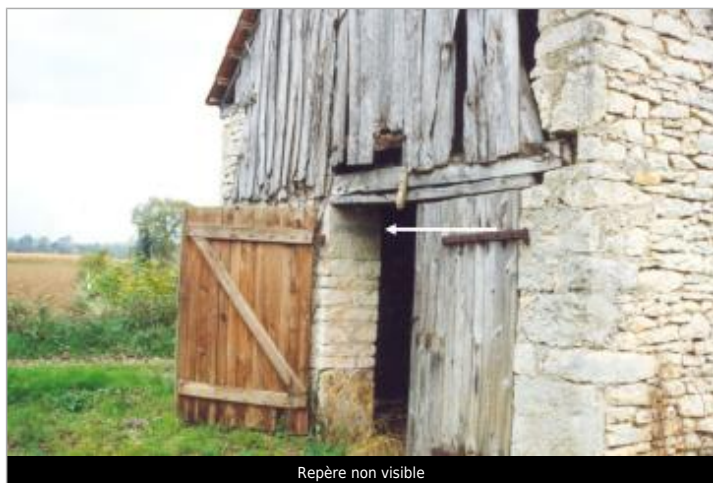
Repère non visible