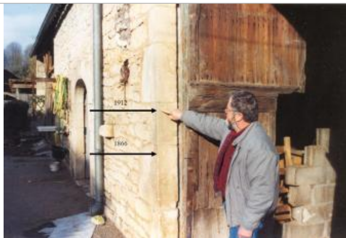
Vue sur un bâtiment qui porte les repères des crues. Les deux repères se distinguent difficilement sur la photographie.

Altitude calculée de l'eau (en m) : 88.35 m