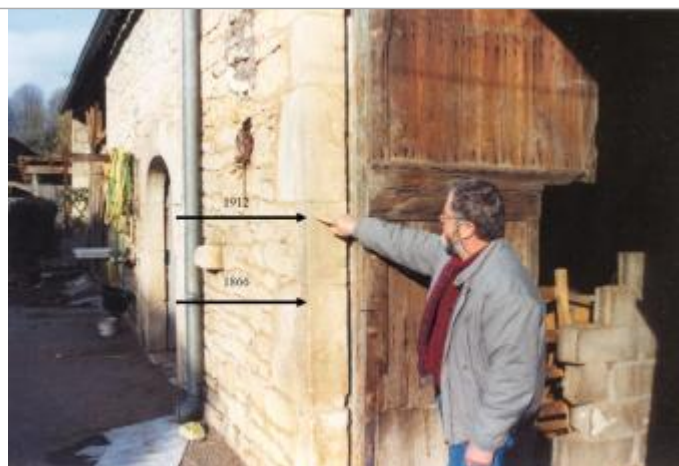
Vue sur un bâtiment qui porte les repères des crues. Les deux repères se distinguent difficilement sur la photographie.