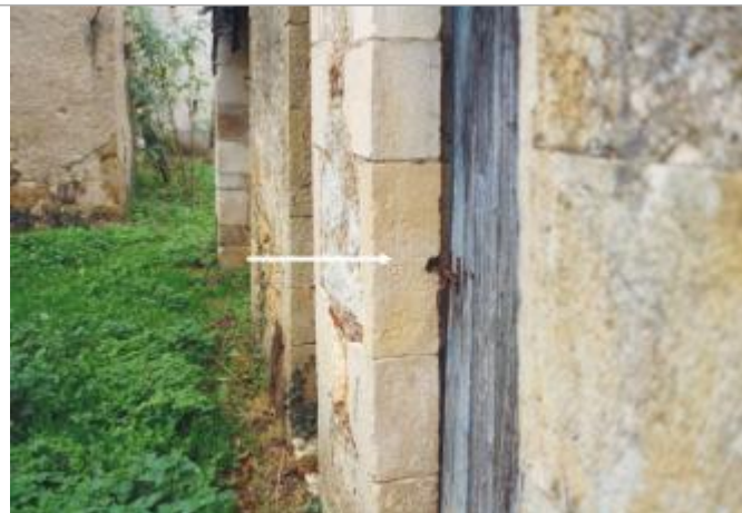
sur un bâtiment qui porte un repère.