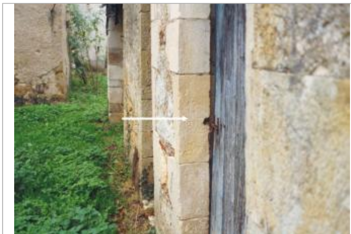
sur un bâtiment qui porte un repère.