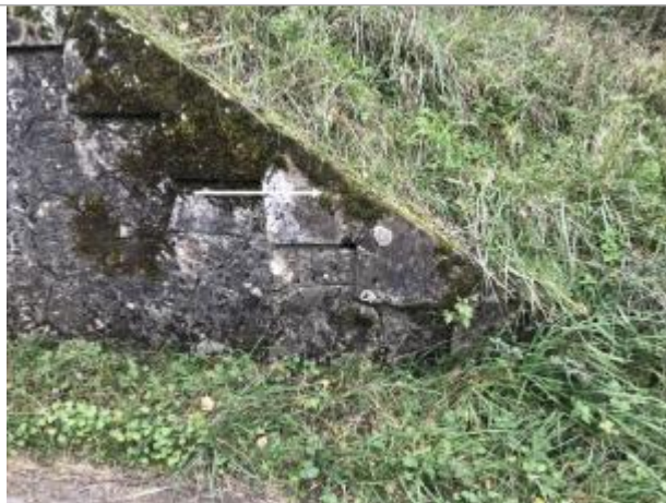
Vue sur le passage de la D 80 sous la voie ferrée.