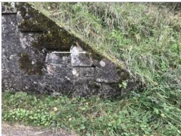
Vue sur le passage de la D 80 sous la voie ferrée. La maçonnerie du passage porte un repère de crue non daté

Texte : La maçonnerie du passage porte un repère de crue non daté Visibilité : Oui