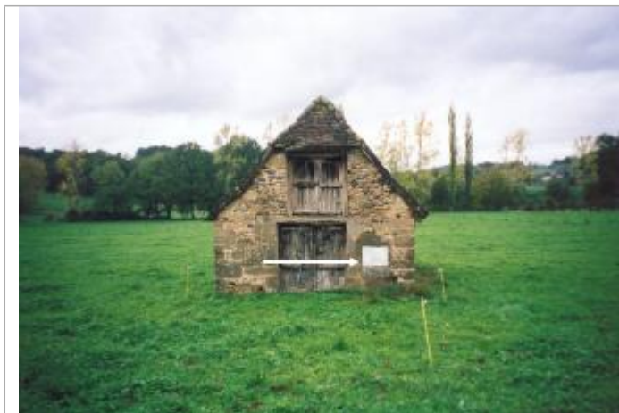
Vue générale sur un bâtiment qui porte un repère

Coordonnées WGS84 : X: 1.83909318 / Y: 44.95065950