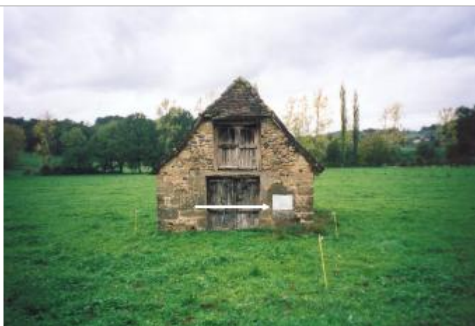
Vue générale sur un bâtiment qui porte un repère

Altitude calculée de l'eau (en m) : 137.88