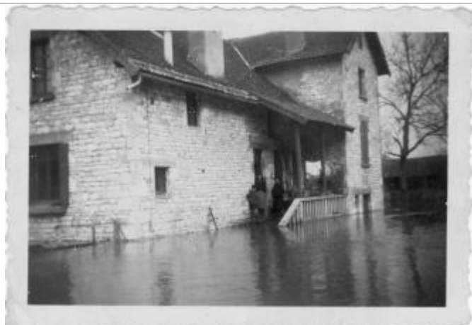
Vue sur un bâtiment qui porte une marque.

Altitude calculée de l'eau (en m) : 88.5 m