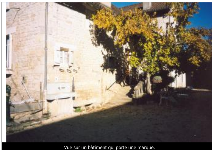
Vue sur un bâtiment qui porte une marque.