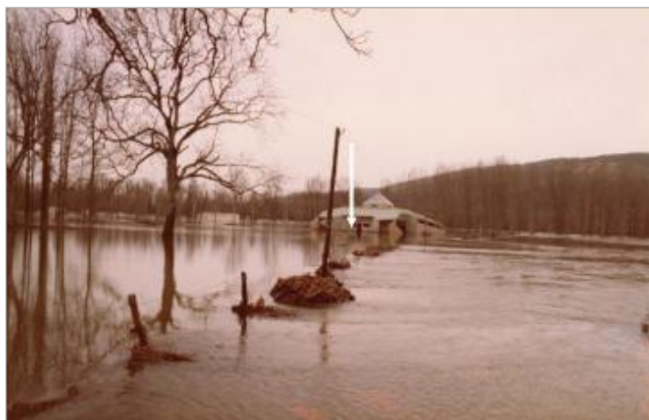
Vue en direction du camping. La trace d'humidité laissée par la crue (flèches) montre que la photographie a été prise pendant la décrue.

Altitude calculée de l'eau (en m) : 89.9