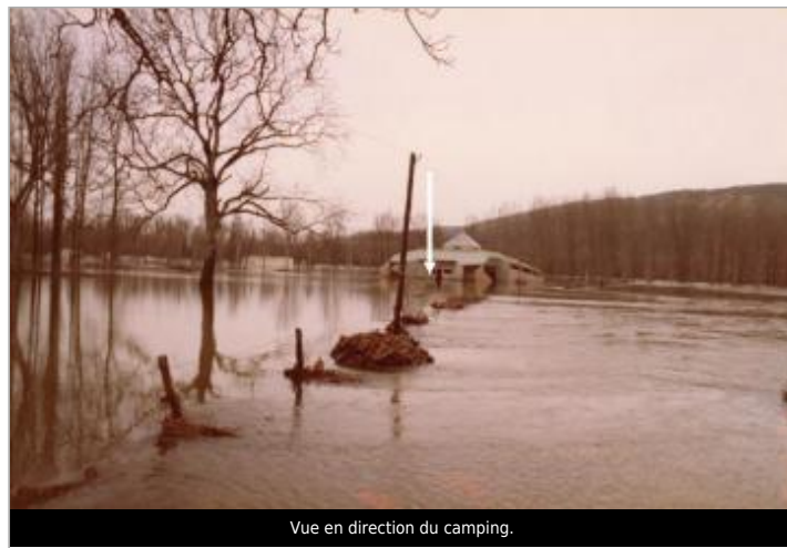
Vue en direction du camping.