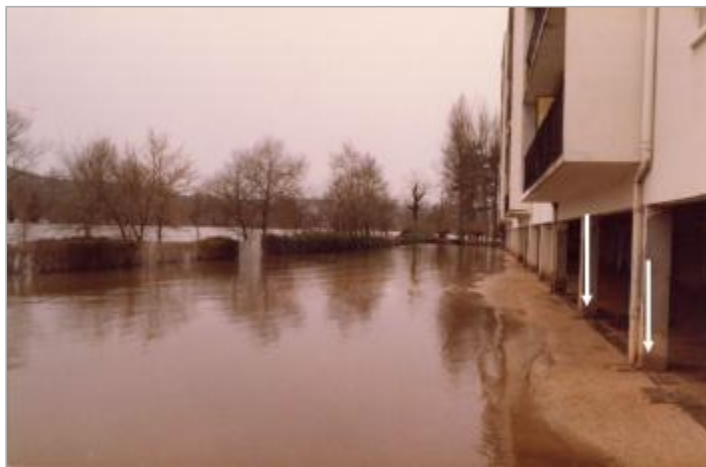
Vue vers l'aval sur un bâtiment situé en bordure du chemin du Port.