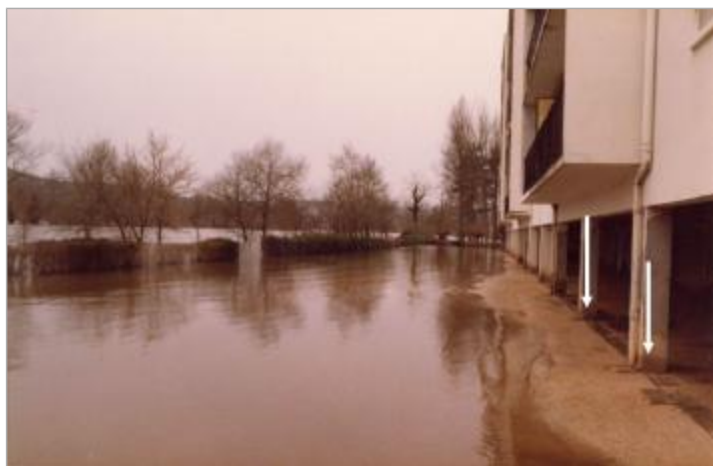
Vue vers l'aval sur un bâtiment situé en bordure du chemin du Port. La trace d'humidité laissée par la crue (flèches) montre que la photographie a été prise pendant la décrue.

Maximum de l'inondation : Non renseigné Visibilité : Oui