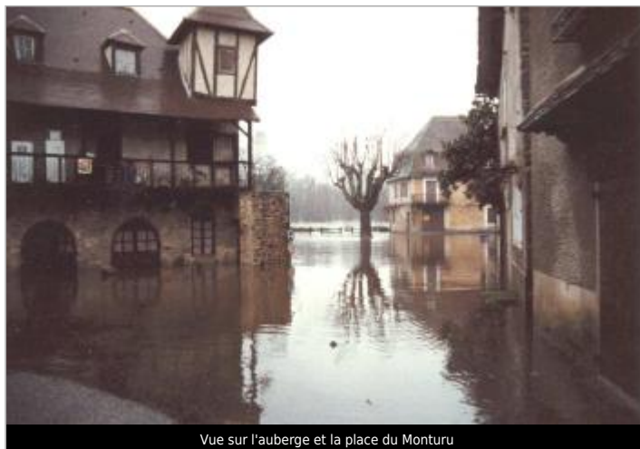
Vue sur l'auberge et la place du Monturu