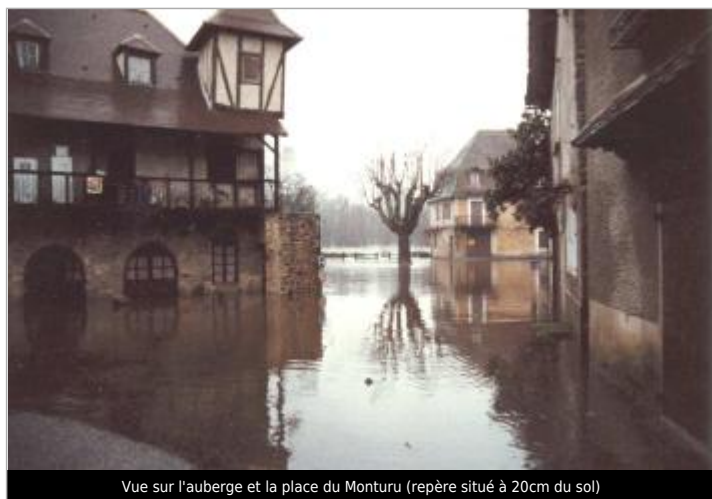
Vue sur l'auberge et la place du Monturu (repère situé à 20cm du sol)

Altitude calculée de l'eau (en m) : 143.34