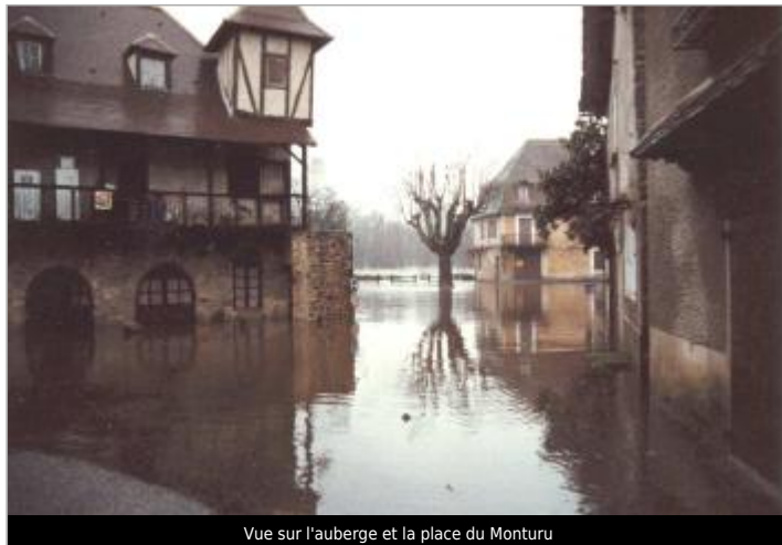
Vue sur l'auberge et la place du Monturu