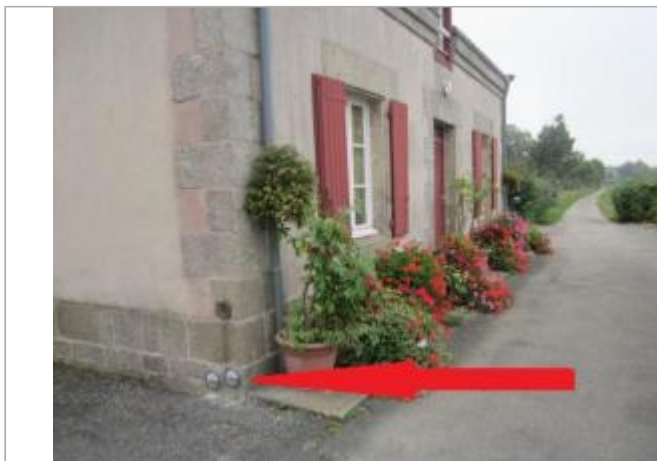
Maison éclusière n°2 Lestitut

Coordonnées WGS84 : X: -2.96096460 / Y: 48.05292140