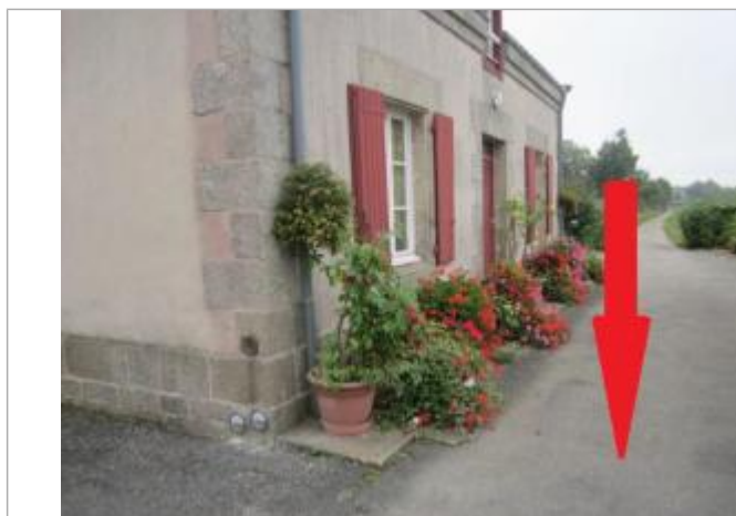
terre-plein de l'écluse

Altitude calculée de l'eau (en m) : 54.75 m