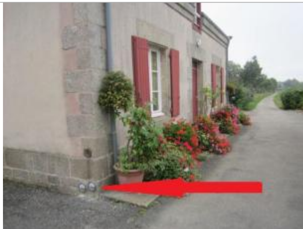
Maison éclusière n°2 Lestitut