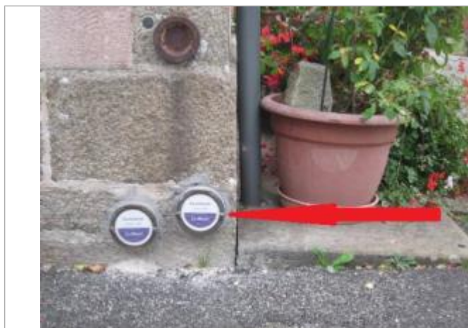
Repère normalisé de l'inondation du 23 août 1880