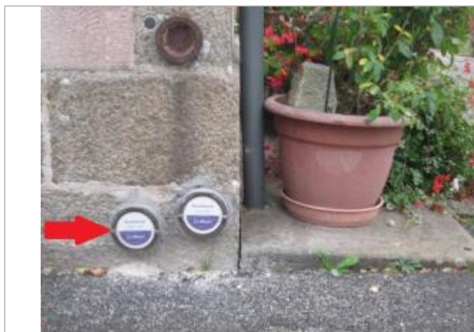
Repère normalisé de l'inondation du 23 janvier 1995

Altitude calculée de l'eau (en m) : 54.98 m