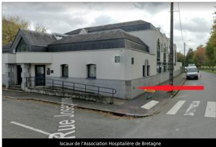
locaux de l'Association Hospitalière de Bretagne