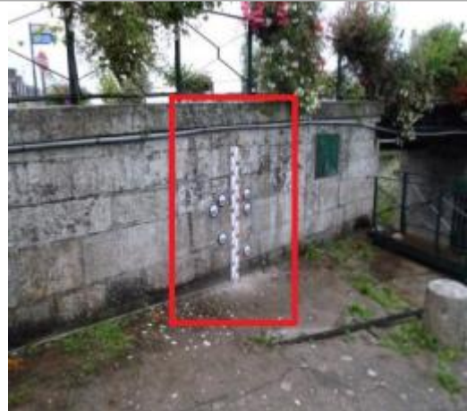
Mur amont du pont des Recollets coté écluse

Coordonnées WGS84 : X: -2.96616630 / Y: 48.07027900