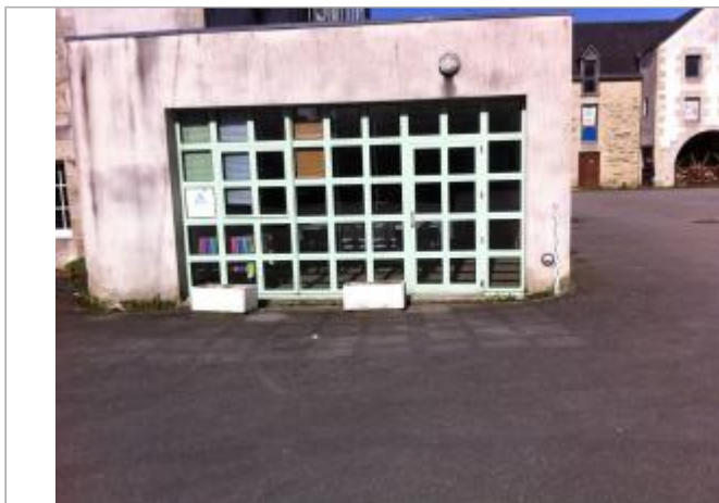
Façade de l'auberge de jeunesse