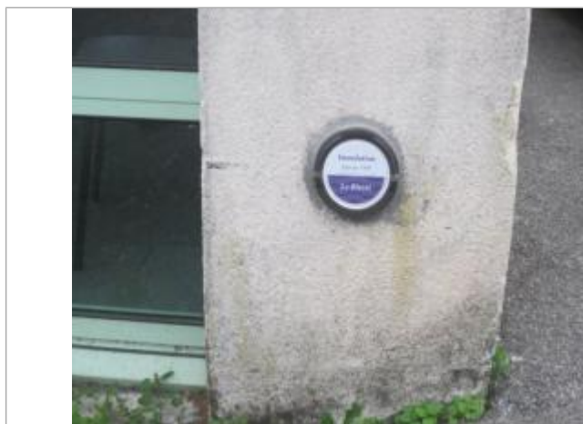
Repère normalisé de l'inondation du 23 janvier 1995