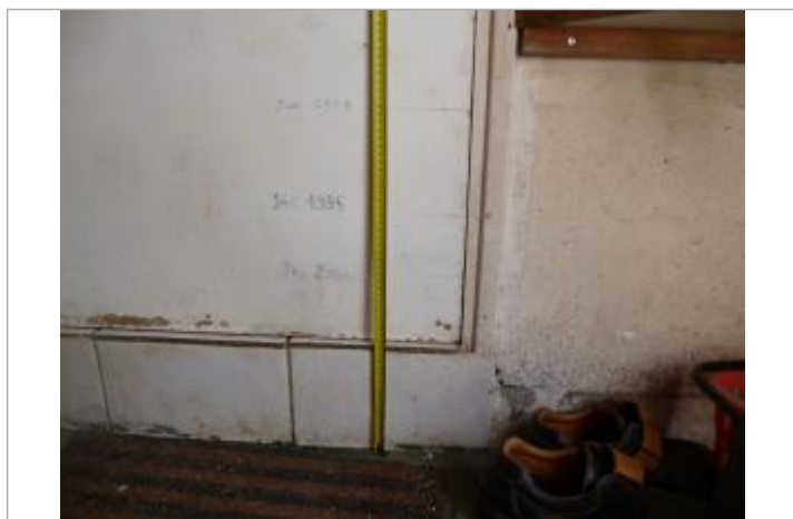
Laisse de crue intérieur de la maison éclusière (Décembre 2000, Janvier 1995 et Janvier 2001)