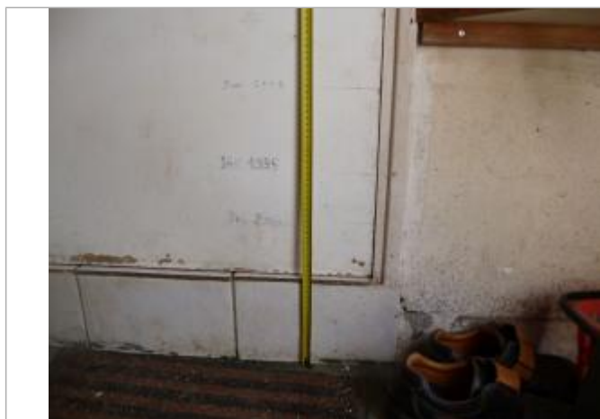
Laisse de crue intérieur de la maison éclusière (Décembre 2000, Janvier 1995 et Janvier 2001)

Altitude calculée de l'eau (en m) : 25.41 m