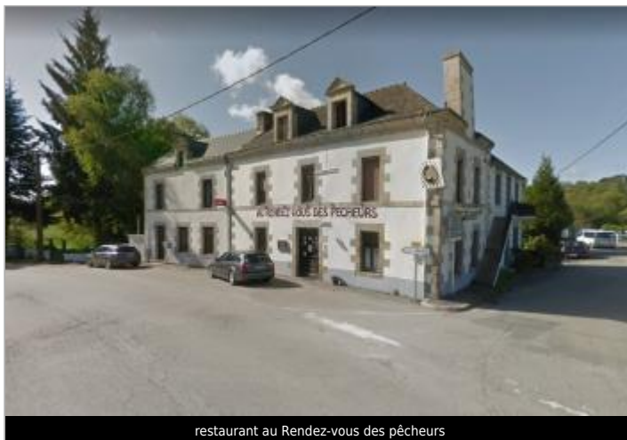
restaurant au Rendez-vous des pêcheurs

GÉOLOCALISATION Coordonnées WGS84 : X: -3.11026820 / Y: 47.88296100 Coordonnées RGF93 (Lambert 93) X: 243748 / Y: 6771280.18 Coordonnées RGF93 (ETRS89) : X: -3.1102682 / Y: 47.882961 Code Hydro: J5--0210 Rive de référence: Gauche