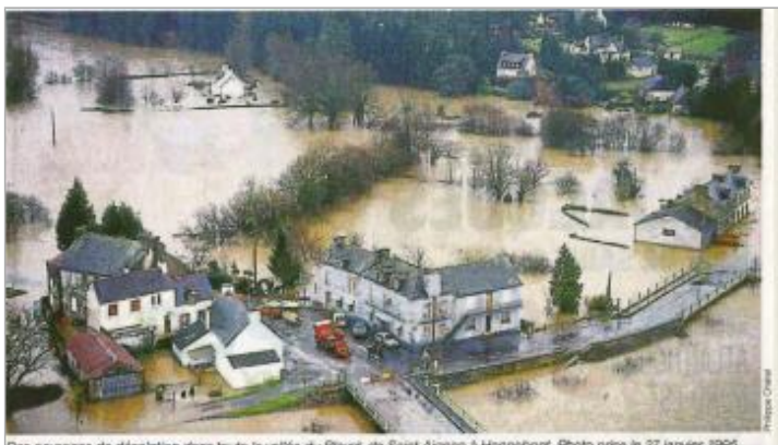
Des paysages de désolation dans toute la vallée du Blavet, de Saint-Aignan à Harnéfont. Photo prise le 27 janvier 1995. Pont-Augan, photo aérienne prise le 27 janvier 1995

MARQUE Maximum de l'inondation : Oui Visibilité : Non État du repère : Non renseigné Pérennité : Aucune Repère calculé : Non PHEC : Non