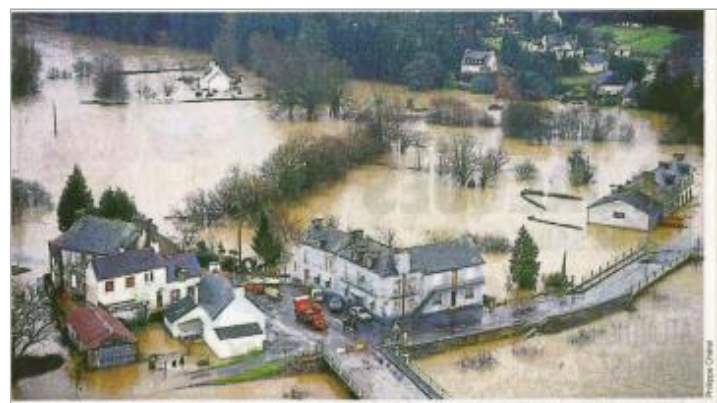
Des paysages de désolation dans toute la vallée du Blavet, de Saint-Aignan à Harnéfont. Photo prise le 27 janvier 1995. Pont-Augan, photo aérienne prise le 27 janvier 1995

MARQUE Maximum de l'inondation : Oui Visibilité : Non État du repère : Non renseigné Pérennité : Aucune Repère calculé : Non PHEC : Non