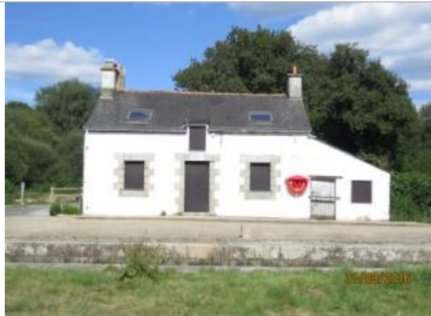
Maison et écluse n°20 Manerven