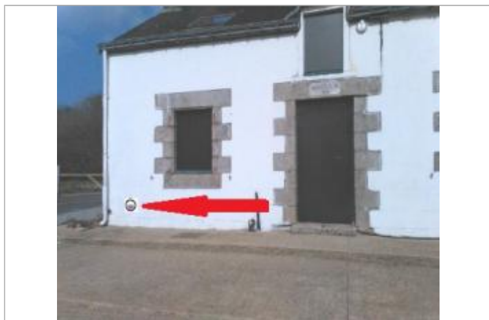
projet d'installation repère normalisé

Altitude calculée de l'eau (en m) : 21.18