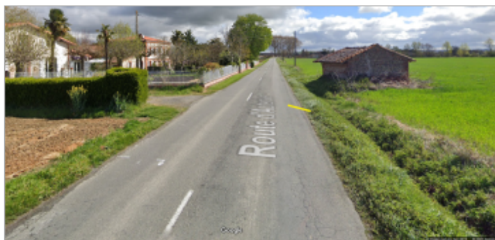
Limite du débordement par dessus la RD48 : repère jaune sur la photo