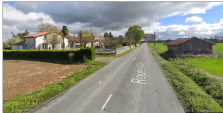
Vue du hameau en direction d'Auterive - Google (c) avril 2019