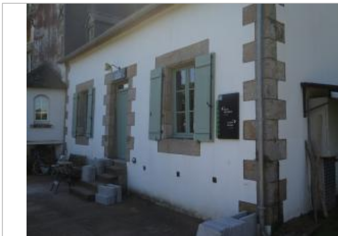
Maison éclusière en 2022

Altitude calculée de l'eau (en m) : 51.41 m