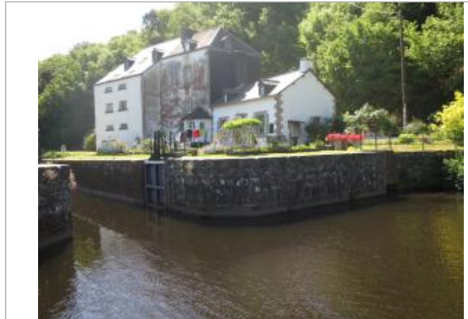
Site de la maison éclusière n°4 Le Roc'h en 2022