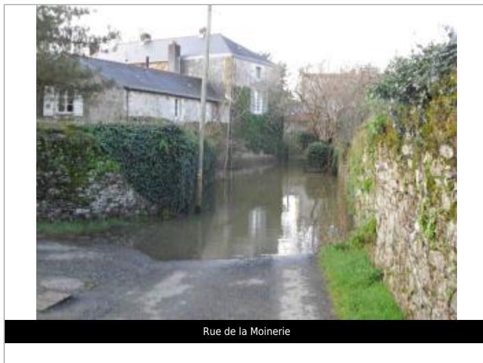
Rue de la Moinerie