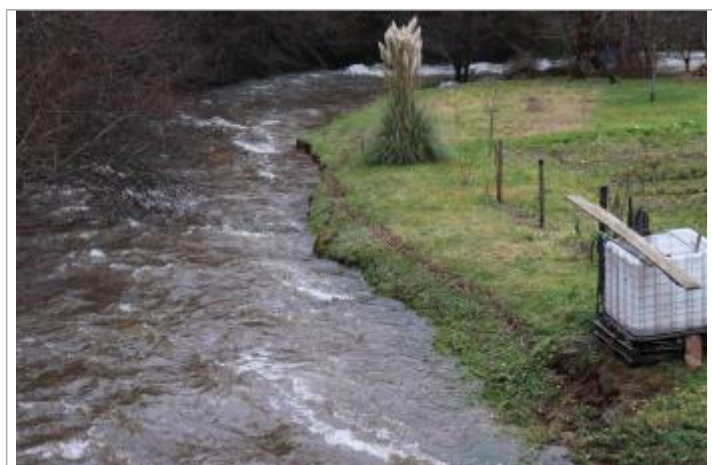
Laisse de crue temporaire