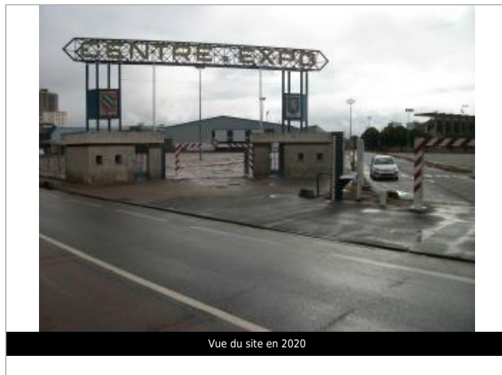
Vue du site en 2020