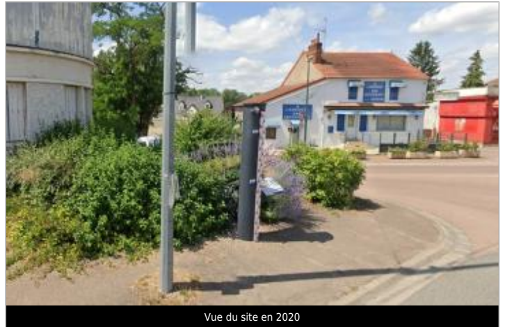
Vue du site en 2020