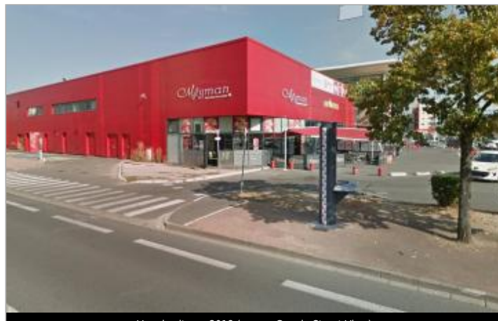
Vue du site en 2018