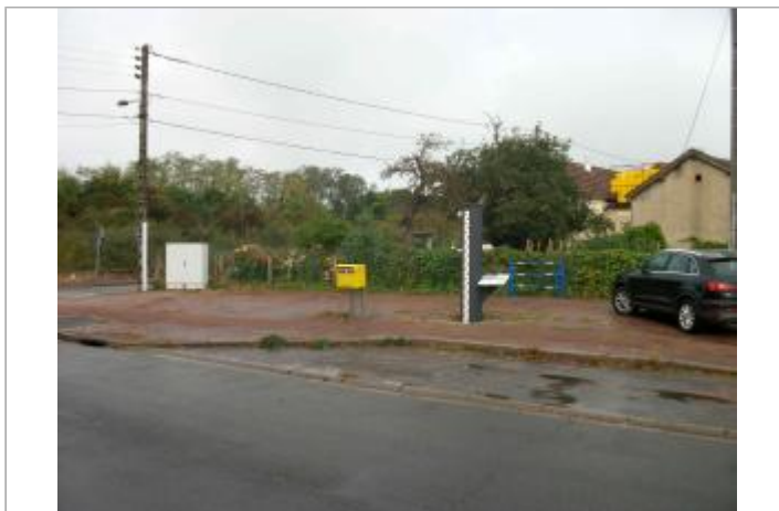
Vue du site en 2020