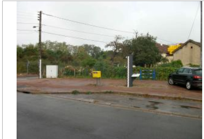
Vue du site en 2020

Coordonnées WGS84 : X: 3.18090900 / Y: 46.99267300