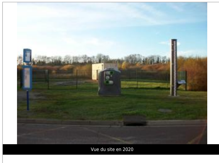
Vue du site en 2020