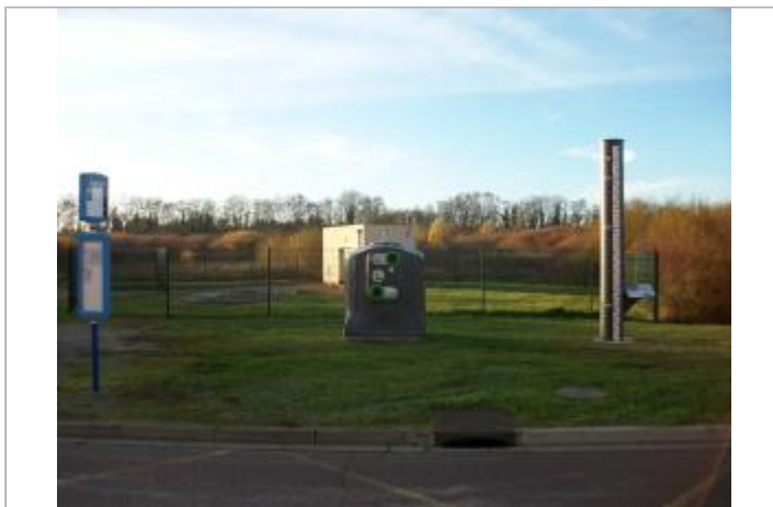
Vue du site en 2020