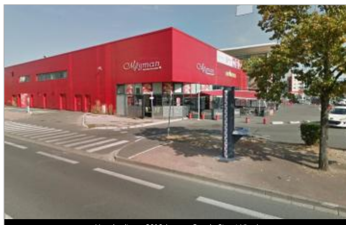
Vue du site en 2018