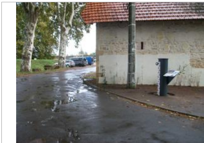
Vue du site en 2020