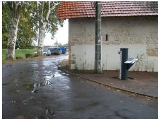
Vue du site en 2020