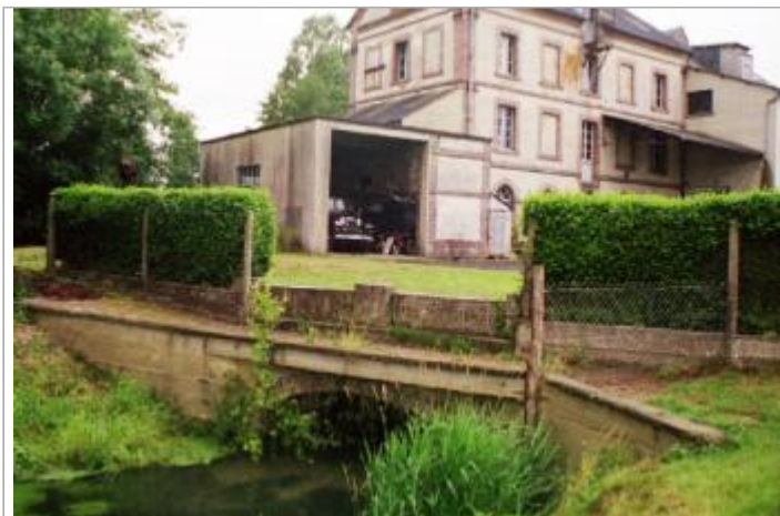
Moulin de Beaufai