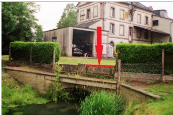
Laisse de crue au niveau haut des pierres à la sortie du bras usinier

Altitude calculée de l'eau (en m) : 219.2 m