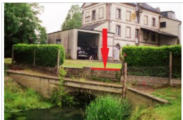
Laisse de crue au niveau haut des pierres à la sortie du bras usinier

Texte : Laisse de crues au niveau du haut des pierres à la sortie du bras usinier Maximum de l'inondation : Oui Visibilité : Non État du repère : Bon Pérennité : Longue