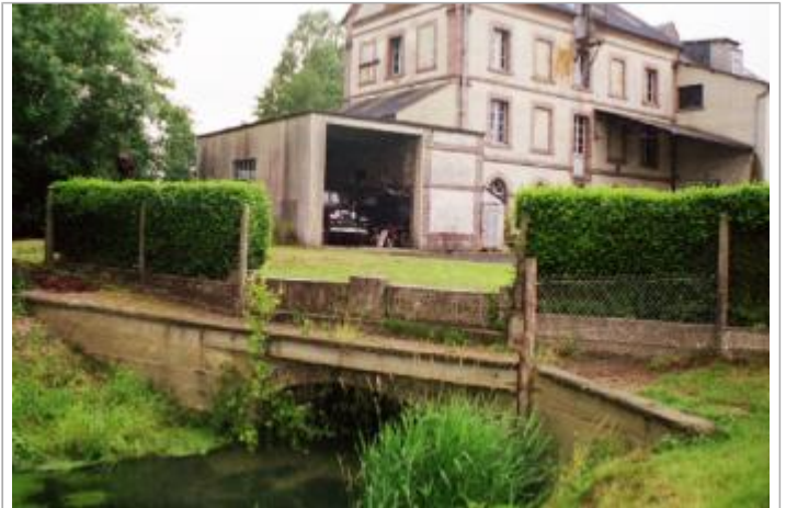
Moulin de Beaufai