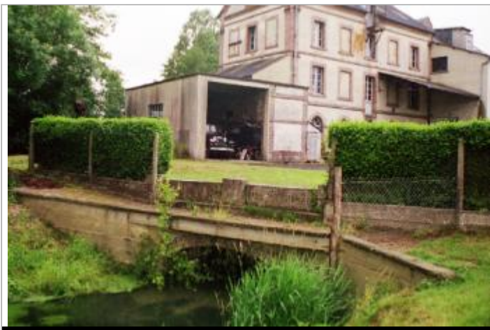
Moulin de Beaufai

GÉOLOCALISATION Coordonnées WGS84 : X: 0.51411378 / Y: 48.73493600 Coordonnées RGF93 (Lambert 93) X: 517205.55 / Y: 6851190.18 Coordonnées RGF93 (ETRS89) : X: 0.5141138 / Y: 48.734936 Code Hydro: H6--0200 Rive de référence: Gauche