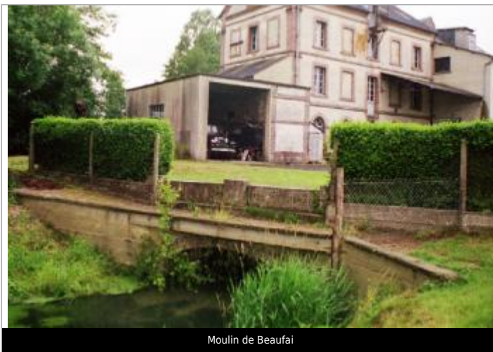
Moulin de Beaufai

GÉOLOCALISATION Coordonnées WGS84 : X: 0.51411378 / Y: 48.73493600 Coordonnées RGF93 (Lambert 93) X: 517205.55 / Y: 6851190.18 Coordonnées RGF93 (ETRS89) : X: 0.5141138 / Y: 48.734936 Code Hydro: H6--0200 Rive de référence: Gauche