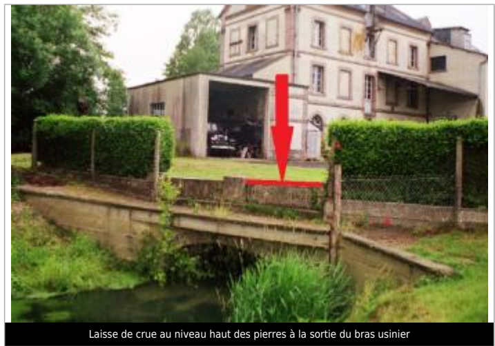
Laisse de crue au niveau haut des pierres à la sortie du bras usinier

MARQUE Texte : Laisse de crues au niveau du haut des pierres à la sortie du bras usinier Maximum de l'inondation : Oui Visibilité : Non État du repère : Bon Pérennité : Longue