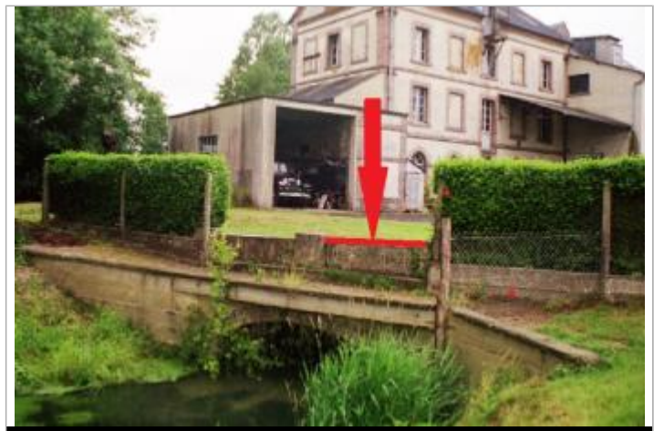
Laisse de crue au niveau haut des pierres à la sortie du bras usinier

MARQUE Texte : Laisse de crues au niveau du haut des pierres à la sortie du bras usinier Maximum de l'inondation : Oui Visibilité : Non État du repère : Bon Pérennité : Longue