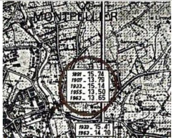
Croquis du site

Coordonnées WGS84 : X: 3.89746086 / Y: 43.60615640